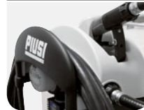
Large & Robust Hose Holder