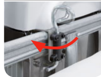
New Safety lock bracket system