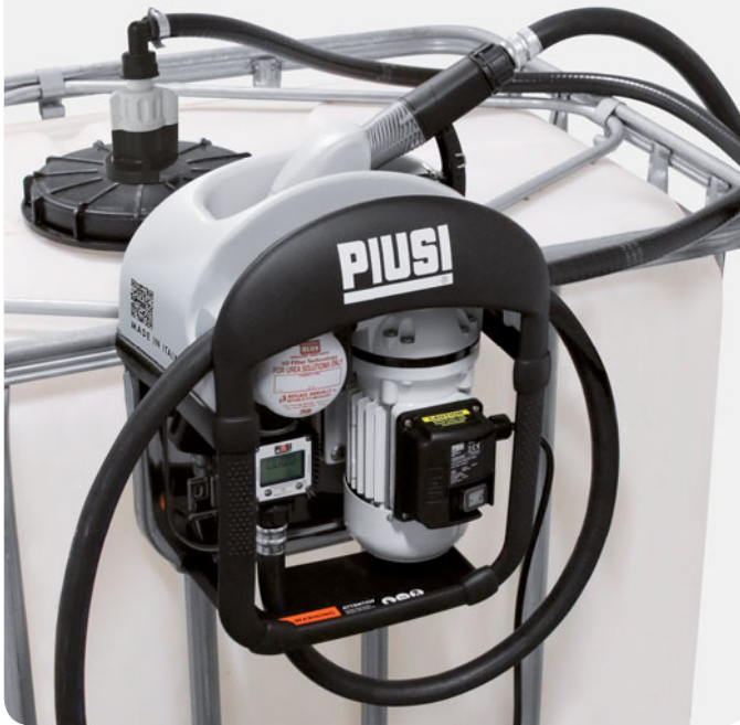
PIUSI THREE25 with SEC, K24 and SB325