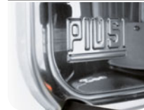
Sturdy Stainless Steel Plate