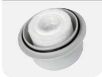
AdBlue® long life 3D Filter