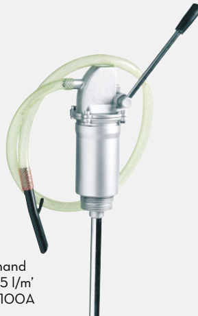
Piston hand pump 35 l/m' F0035100A