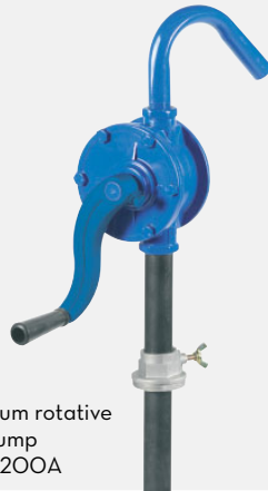
Aluminium rotative hand pump F0033200A