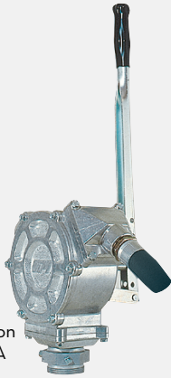
PM GPI Piston F0031600A