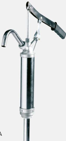
Piston hand pump 25 l/m' F0034900A