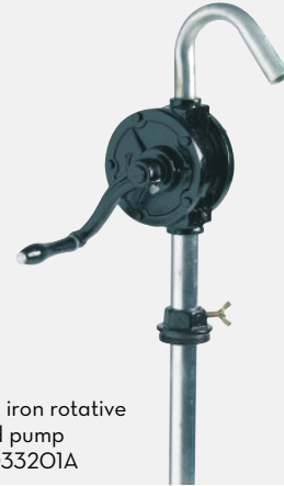
Cast iron rotative hand pump F0033201A